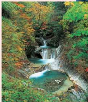
西沢渓谷(森林セラピー基地) 七ツ釜五段の滝

国内屈指の深谷美を誇り、ハイカーに人気です。大小さまざまな美しい滝と初夏のシャクナゲや秋の紅葉も見事です。平成の名水百選・日本の滝100選・水鏡の森100選・新日本観光地100選・森林浴の森100選