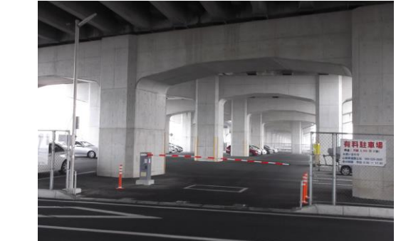
この駐車場は、新山梨環状道路南部区間の高架下の土地を利用しているため、駐車車両には雨や雪がほとんどかかりません。

中央市や南アルプス市方面から、甲府市内やJR身延線沿線の会社等へマイカーで通勤している皆さん、小井川駐車場を利用してマイカーから電車に乗りかえる「パークアンド（レール）ライド」で、地球環境にやさしい生活を始めてみませんか。