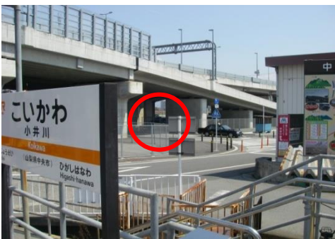
小井川駅から駐車場が見えます。